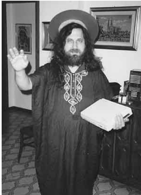
Stallman nei panni di Sant’Ignucius.

“Io sono Sant’Ignucius della Chiesa dell’Emacs”, recita alzando la mano destra come a dispensare la benedizione. “Sono qui a benedire i vostri computer, figli miei.”